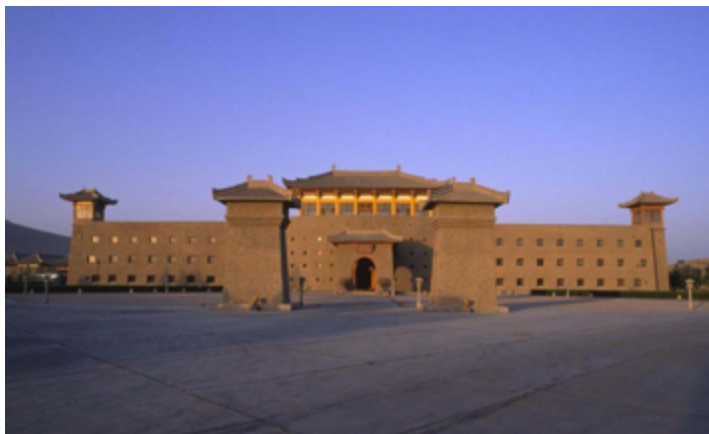
Dunhuang Silk Road Hotel

Tag 10: Zug nach Urumqi und Transfer zum Flughafen